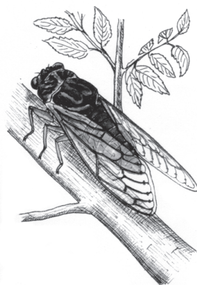
Cicada orni L.

Pridi, moj škržadek: tesno me objemi, sredi žarnega poletja sladko vkup zgoriva!«